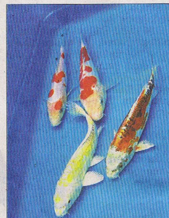
Mit seinen prächtigen Farben ist der Koi ein Liebhaberstück.